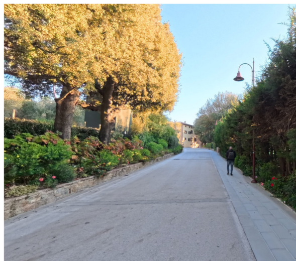
4 Via Castelfalfi Castello