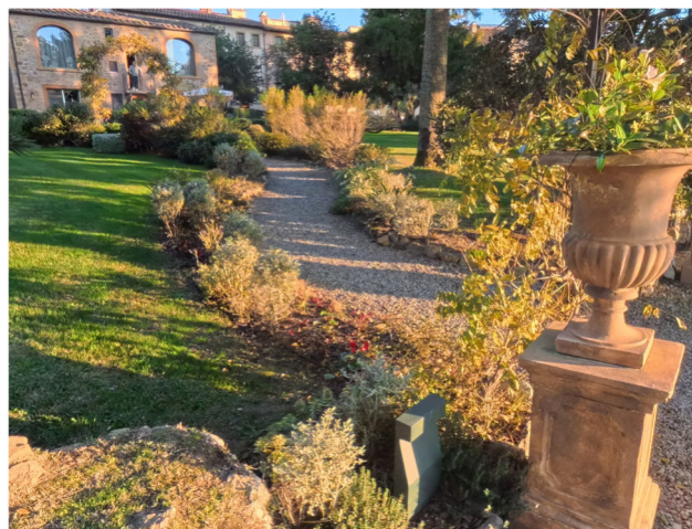
10 vialetti interni parco