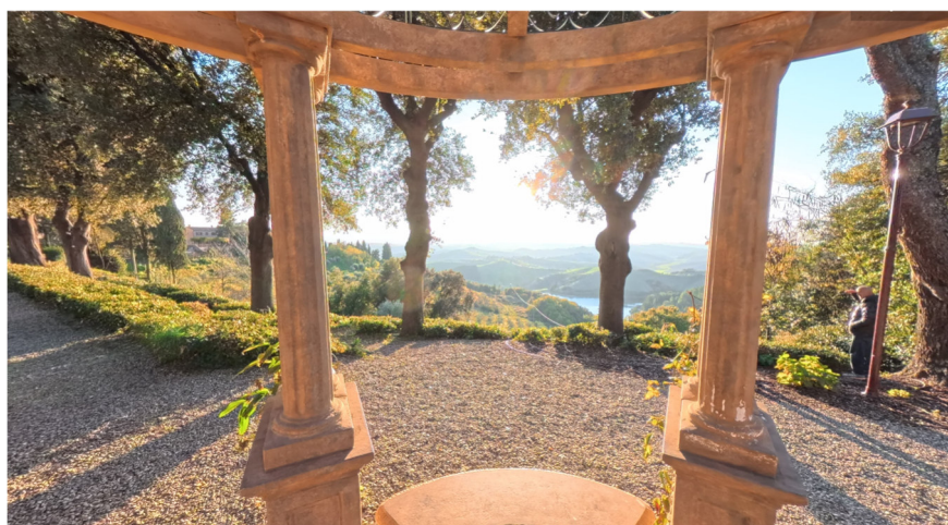
11 scorci sul paesaggio da parco