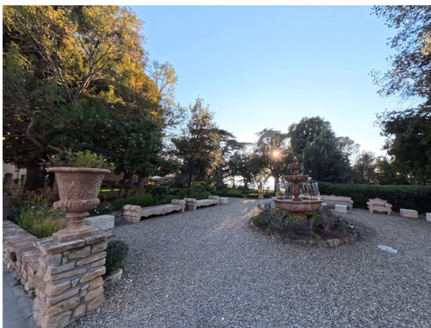
9 spazio parco di fronte alla Chiesa

L'accesso è libero e con percorsi con tratti di selciato in ghiaia. Tuttavia, anche per chi ha mobilità ridotta, con l'ausilio di un propulsore elettrico è comunque possibile godere di suggestivi scorci naturali.