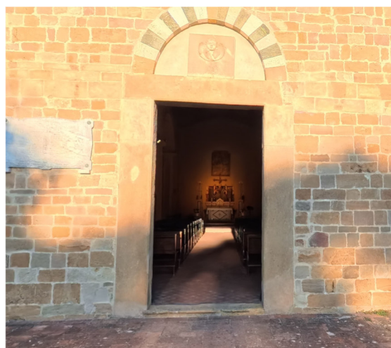
7 ingresso Chiesa