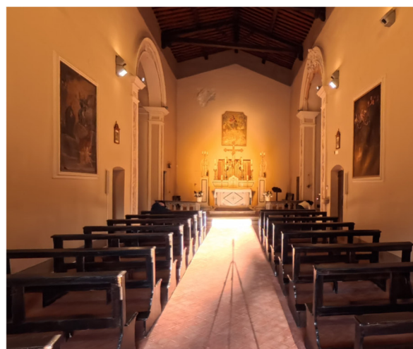
8 interno della Chiesa