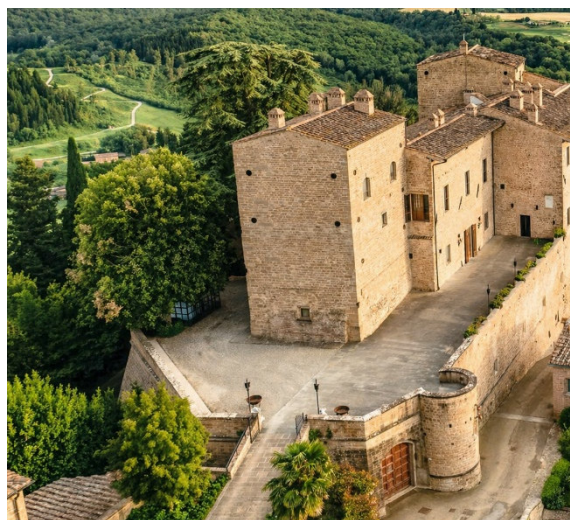
13 panoramica Castello e Rocca