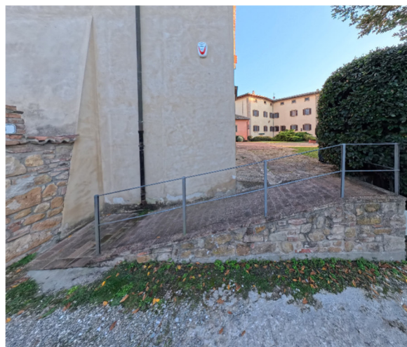
6 rampa laterale Chiesa