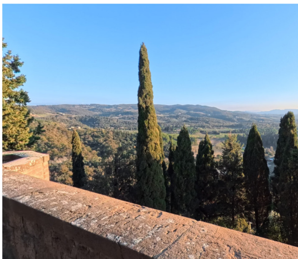
14 vista dal Castello