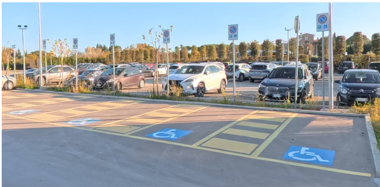
1 posti auto riservati CUDE