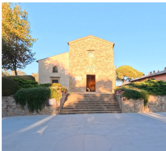
5 Chiesa San Frediano