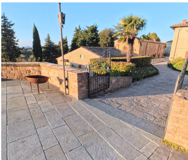
12 rampa che collega la via principale al Castello