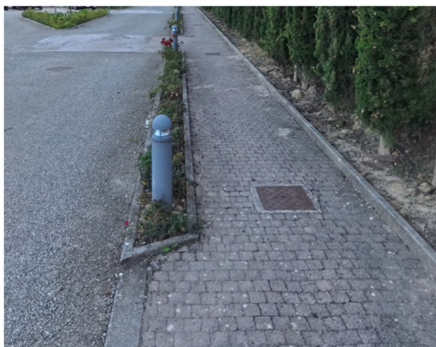
2 percorso dal parcheggio a ingresso borgo

le strade sono perfettamente lastricate fino all'accesso della Rocca di Castelfalfi, che è stata adibita a luogo di residenza e di ristorazione.